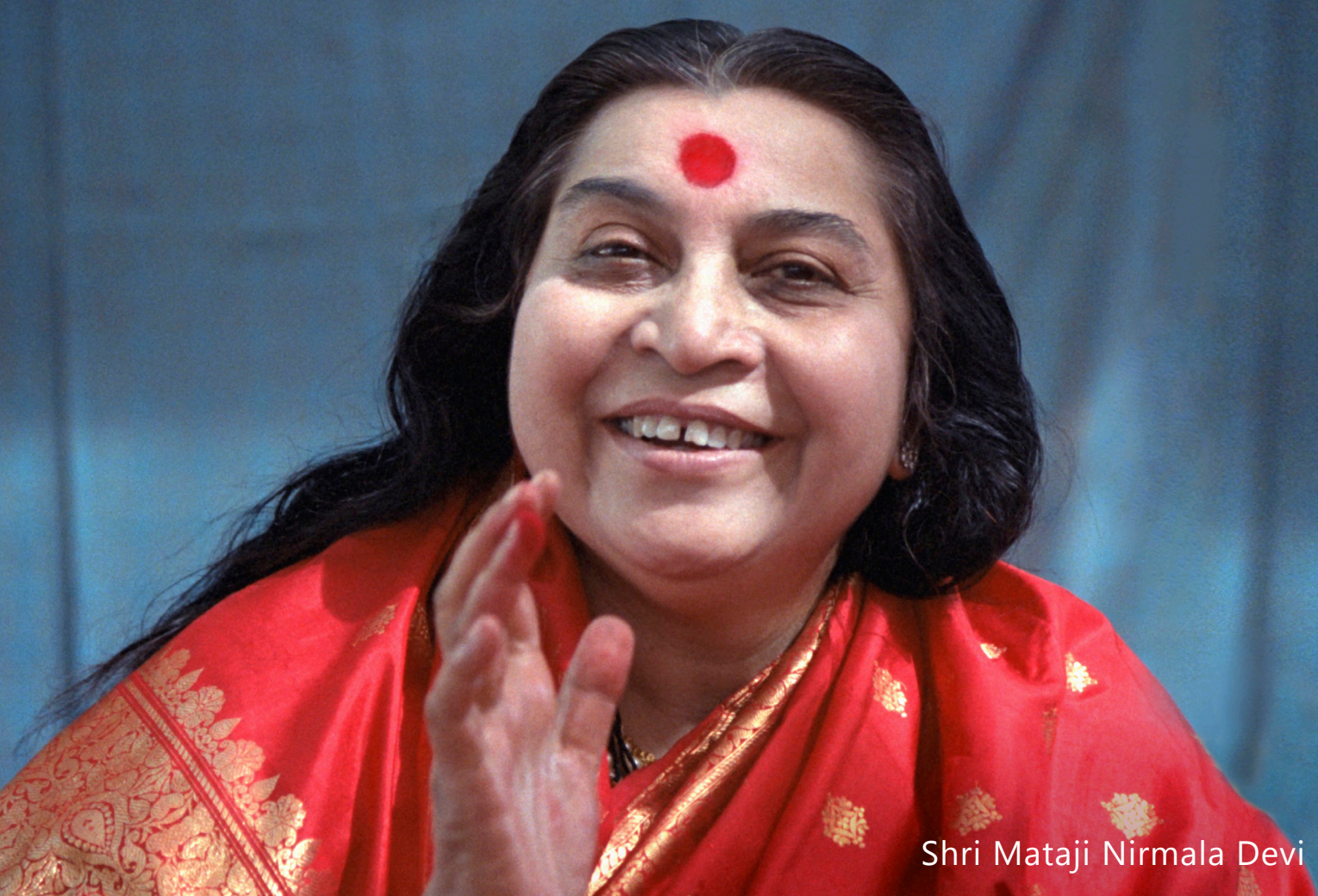
Shri Mataji Nirmala Devi